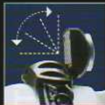
Lampenkopf in 4 Stufen 90° rastend schwenkbar